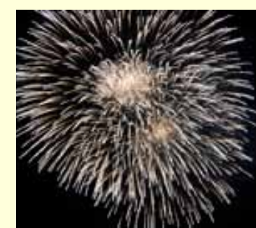
Le quattro giornate di giochi di artificio sono state caratterizzate dalla presenza di tanta gente.