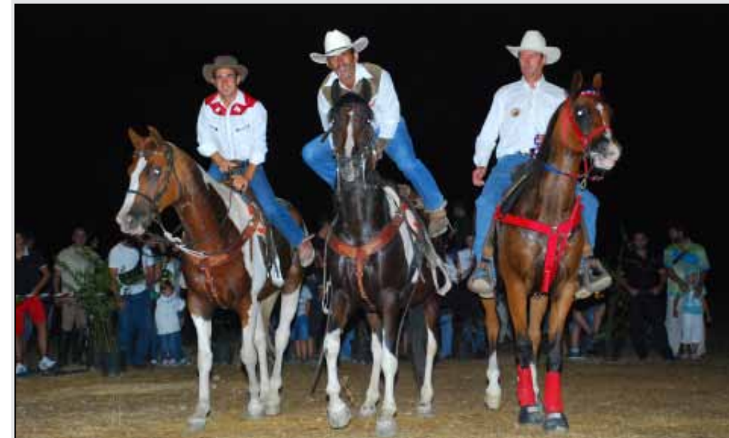
Show di cavalieri e cavalli