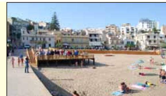
La terrazza realizzata in legno in piazza Empedocle, bella e utile, è destinata a durare pochissimo: numerosi sono già i buchi a poco più di un mese dalla sua inaugurazione.