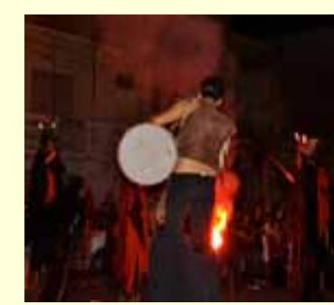
Gli artisti di strada con i trampoli hanno preceduto con le loro esibizioni i giochi di artificio.