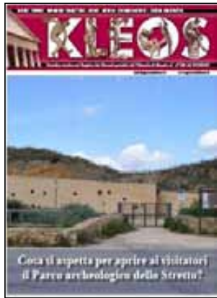
Cosa si aspetta per aprire al visitatori il Parco archeologico dello Stretto?

tifica e culturale in merito alle iniziative da adottare relative al sito del tardo neolitico di contrada "Stretto" e del museo della preistoria del basso belice e valorizzare le due strutture. Con la convenzione, che ha la durata di un anno, sarà possibile aprire al pubblico il Parco archeologico, non appena però la struttura già costruita in contrada Stretto sarà arredata (e questo non è un particolare di poco conto dato che può far rimandare l'inaugurazione a chissà quando).