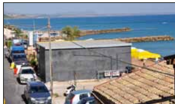
In primo piano la struttura che è sorta come un fungo in piena Piazza Efebo. E' stata positiva l'esigenza di creare movimento con un punto di ristoro, ma la costruzione è proprio un pugno in un occhio!

puntato di più l'amministrazione del sindaco Gianni Pompeo sono state però certamente quelle connesse alla festa del fuoco, non solo con quattro giornate differenti (nelle quattro domeniche del mese di agosto) di giochi di artificio di livello, ma anche con iniziative collaterali come ad esempio lo spettacolo per le vie della borgata da parte degli artisti di strada sui trampoli. Lodevole, dunque, il tentativo di quest'anno (più tangibile) da parte dell'amministrazione di muoversi in tutte quelle direzioni di cui si è detto, per evitare che Marinella di Selinunte d'estate si configurasse come una zona di soggiorno per anziani che vogliono solo riposare, ma qualche cosa si poteva pure evitare: ad esempio, la realizzazione di una struttura - in piena piazza! - che è, anche per le caratteristiche estetiche della costruzione, un pugno in un occhio (e oggetto di grande indignazione da parte di tanti) nella centrale piazza Efebo (vedi prima foto da sinistra); altra notazione va fatta sulla realizzazione della terrazza della zona del porticciolo, di per sé utile e bella, ma in legno, e destinata, dunque, a durare pochissimo nel tempo (già a poco più di un mese dalla sua inaugurazione i buchi sono tanti) alla faccia dei, non vorremmo sbagliare, duecentomila euro spesi per realizzarla.