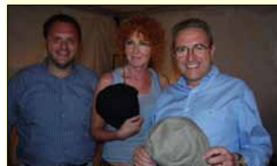
Di fortissimo richiamo lo spettacolo musicale di Fiorella Mannoia (al centro nella foto)