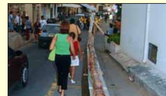
Ancora non si è potuto realizzare il "pani cunzatu" più lungo del mondo.