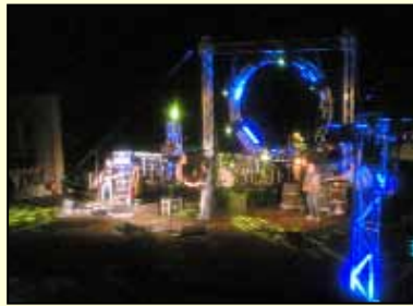
Un momento del concerto dei Nomadi

I concerti della cantante Noemi (in piazza Falcone e Borsellino il 12 agosto, alle 23,30) e quello del cantautore Edoardo Bennato (allo stesso posto alle 23,30 il 20 agosto) sono state le manifestazioni gratuite di richiamo che hanno fatto da traino alla buona riuscita delle notti bianche che hanno accompagnato i due concerti e nelle quali ci sono state degustazioni gratuite di prodotti tipici organizzate in collaborazione con i commercianti partanesi e il pescato siciliano nell'ambito del progetto "Terramare". Il programma denominato Artemusicultura 2010, IV Rassegna culturale "Castello Grifeo" ha presentato spettacoli offerti dall'assessorato regionale al turismo nell'ambito del "Circuito del mito" (38 paesi in Sicilia) in cui è stata inserita pure la città di Partanna. Le manifestazioni in programma (delle quali pochissime sono state a pagamento) hanno avuto inizio l'1 agosto e si sono concluse l'11 settembre. Fra gli eventi più significativi, oltre ai due concerti in piazza, le esibizioni di Peter