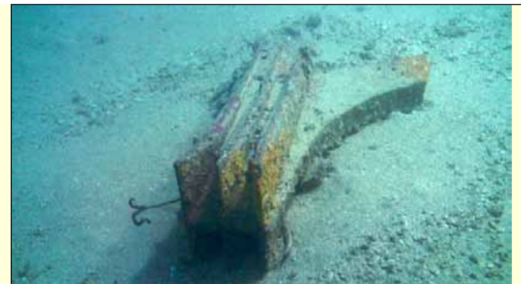
Il rostro ritrovato