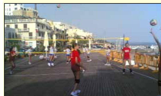
Partita sulla terrazza per far dimenticare lo spazio tolto (con la costruzione della terrazza) al volley sulla spiaggia che prima si praticava con grande seguito di giovani.